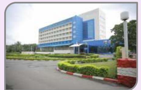
Hôtel Ecole LÉBénin